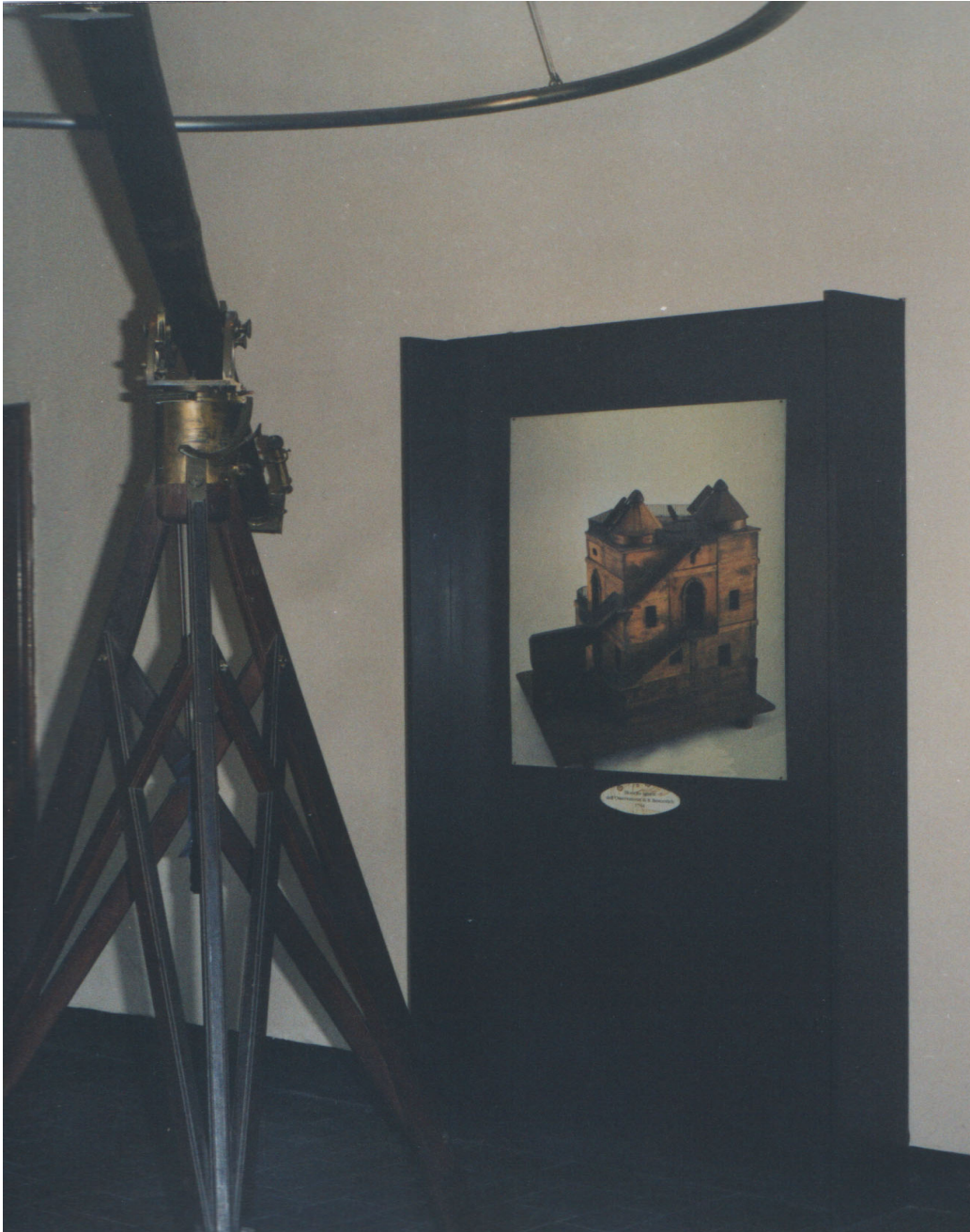
Слика 1. Телескоп и фотографија макете Бошковићеве опсерваторије у Брери.

Бошковић је био припадник католичког реда исусоваца (језуита), чија је значајна улога била да брани црквена од јеретичких учења. Тада је црква учила да је Земља центар свемира и да се Сунце и планете окрећу око ње