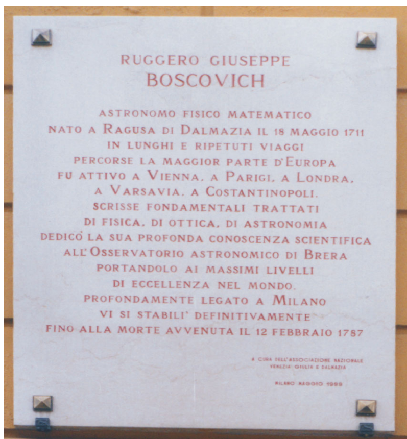
Слика 5. Спомен плоча у улици Руђера Бошковића у Милану.

Бошковић је био славна личност у своје време, члан неколико академија наука (енглеске, француске, руске...), познат као астроном, физичар, математичар, филозоф. Стога једна улица у центру Милана носи Бошковићево име, а у њој се налази спомен плоча посвећена њему (слика 5).