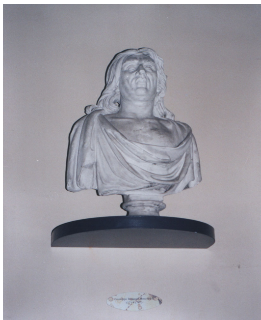
Слика 3. Биста Бошковића у Астрономском институту у Брери.

По завршетку путовања одбија понуду да се поново врати у Римски колегиј, већ 1764. г. прихвата место професора математике у градићу Павија код Милана, који је тада био у оквиру Аустрије. Већ 1765. г. прихвата позив да оснује астрономску опсерваторију у Милану заједно са исусовцима који су смештени у Брери. (То је један кварт који и данас постоји у центру Милана.) Све своје интелектуалне снаге и новчана средства улаже у изградњу опсерваторије (слика 1), а 1770. г. прелази у Милано на место професора астрономије и оптике. До 1772. г. је руководилац опсерваторије заједно са опатом Лагранжом.