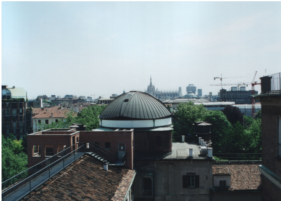
Слика 4. Место на коме се налазила Бошковићева опсерваторија у Брери.

периода Бошковићевог рада у Брери (слика 1). На крову Брере на месту где је некад била Бошковићева опсерваторија данас се налази савремена опсерваторија (слика 4).